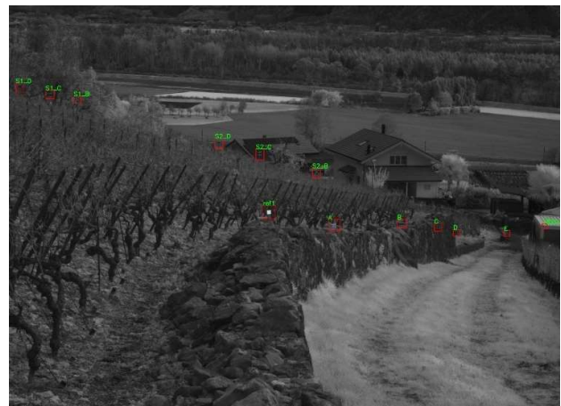
Vue du point VS003 avec références